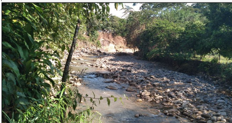
FOTOGRAFIA N°02: CAUCE DE LA QUEBRADA COLMATADO Y EROSIONANDO EN RIBERA