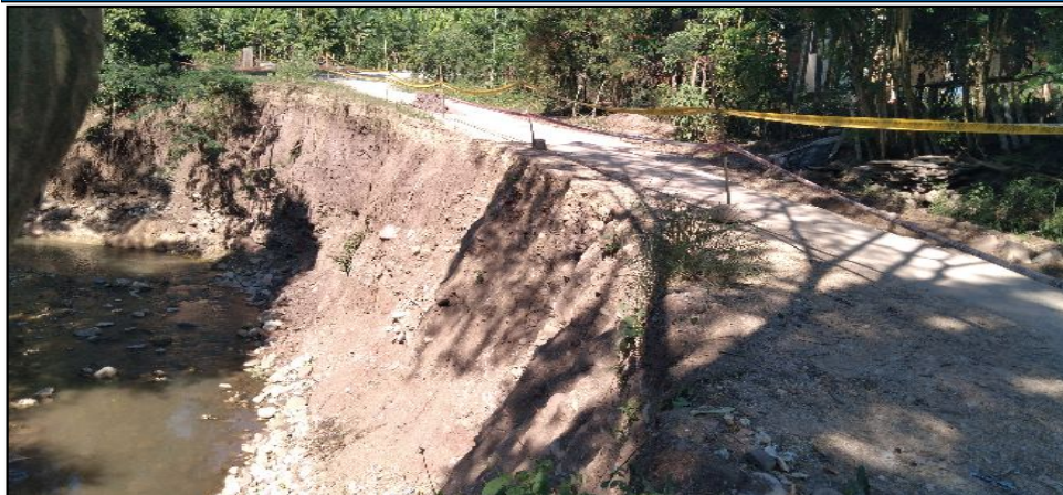
FOTOGRAFIA N°01: EROSION DE LA RIBERA DE LA QUEBRADA QUE AFECTA A CARRETERA